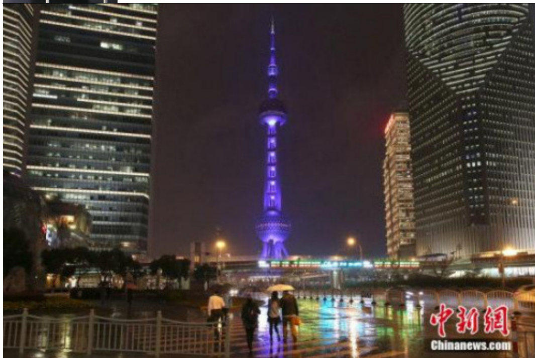
资料图：北京地铁一号线大望路站内人头攒动。

陈诉显示，白领对现在生涯都会有归属感的第一缘故原由是医疗条件好，有57.6%的受访者选择这一选项，48.5%选择怙恃/亲友挚友都在这里定居，35.6%表现是由于生涯便利，33.1%选择事情时机多，生长空间大。